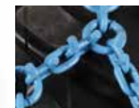
2-Feld Ausführung ohne Spannkette